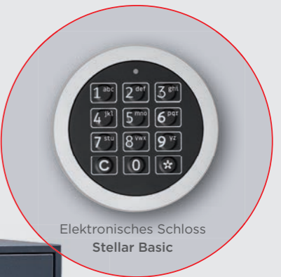
Elektronisches Schloss Stellar Basic